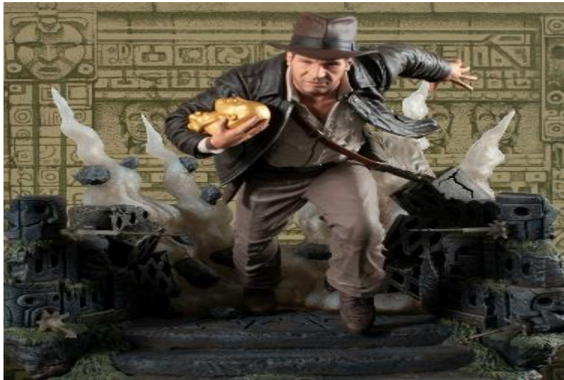
Slika 1: https:// Raiders of the Lost Ark™ - Indiana Jones™ ((gentlegiantltd.com))